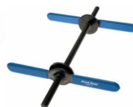
Mounting press Presse de montage