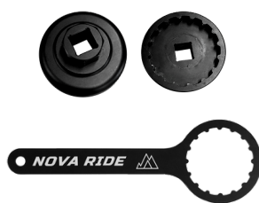
Crankset remover Clé ou douille Nova Ride